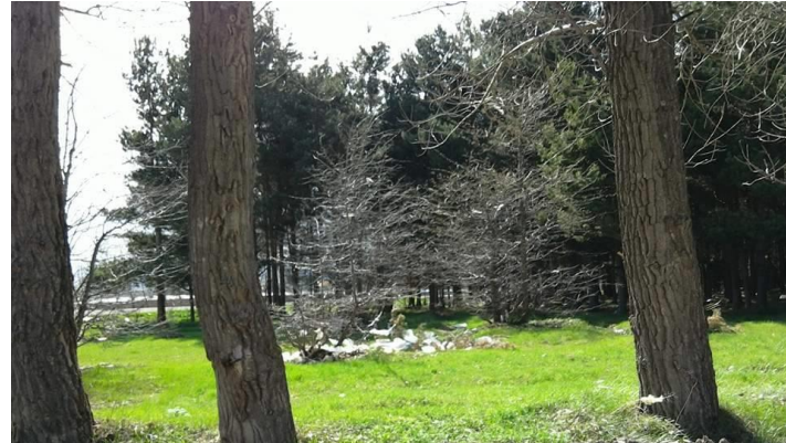
Նկար 6. Աղբը լճի մերձակա անտառային հատվածում, Մարտունի

3. Սևանա լճի շրջակայքում պատմական և զբոսաշրջային այլ արժեք ներկայացնող հուշարձաններին հարող տարածքների մաքրում