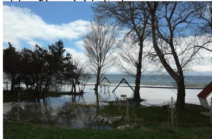
Նկար 11. Լքված տաղավարներ, Շորժա

Սևանի ափին բազմաթիվ են կիսակառույց կամ կիսաքանդ շենքերը և ժամանակավոր (ոչ հիմնական) շինությունները: Այդ շենքերը խաթարում են բնապատկերը և մոայլ տրամադրություն առաջացնում: Ժամանակավոր լքված շինությունները պետք է ապամոնտաժվեն, իսկ կիսաքանդ կամ կիսակառույց շենքերը պետք է կամ վերանորոգվեն և վերագործարկվեն, կամ՝ ապամոնտաժվեն: