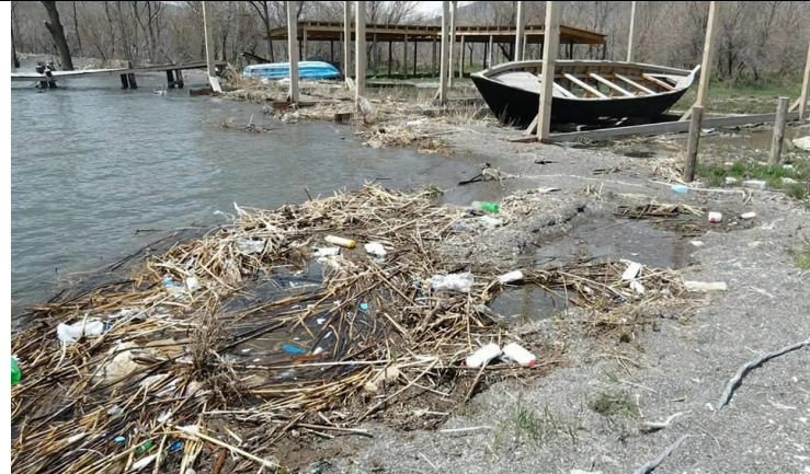
Նկար 5. Ափամերձ հատված, Վարդենիս

մերձակայքում և ափամերձ տարածքներում, ափերին կուտակված աղբը մաքրելու և աղբի կուտակումները կանխելու ուղղությամբ: