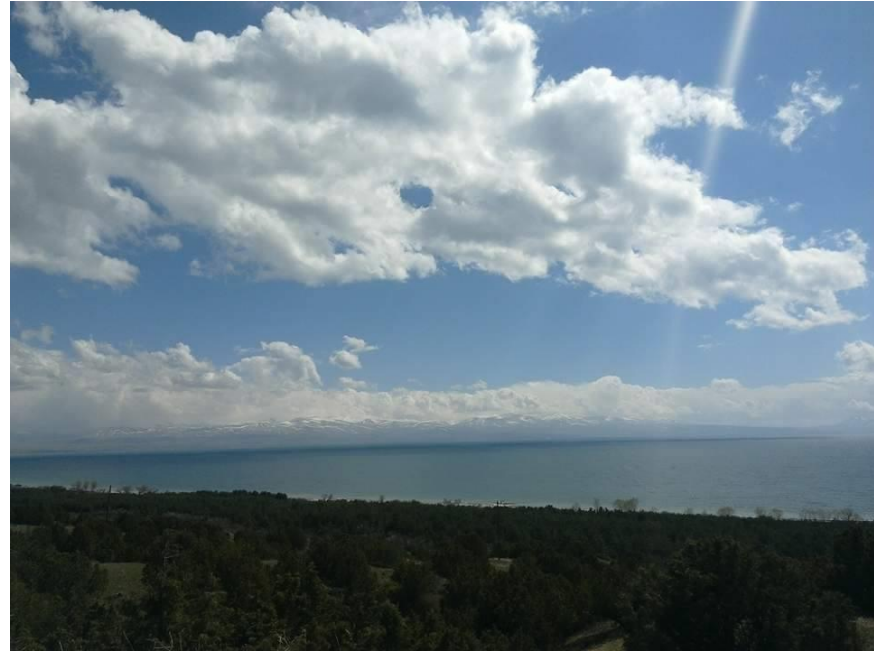
Նկար 1. Տեսարան Սևանի արևելյան ափից, Դարանակ գյուղի մերձակայքում