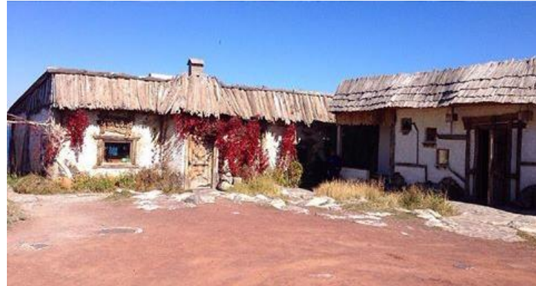
Նկար 10. «Բաշինջաղյան» թեյարանը Սևանի ափին, գ. Նորաշեն

Բացի ոճի պահպանումից պարտադիր պայման պետք է լինի, որ որևէ շինություն չծածկի որևէ պատմական հուշարձանի տեսադաշտը, խոչընդոտի դեպի հուշարձան հասանելիությունը կամ լինի պատմական հուշարձանի հետ ոչ համահունչ: