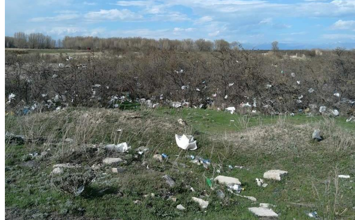
Նկար 5. Կենցաղային աղբափամերձ չիչխանի թփերին

Սևանի ափամերձ անտառները ծառայում են որպես աղբանոցներ: