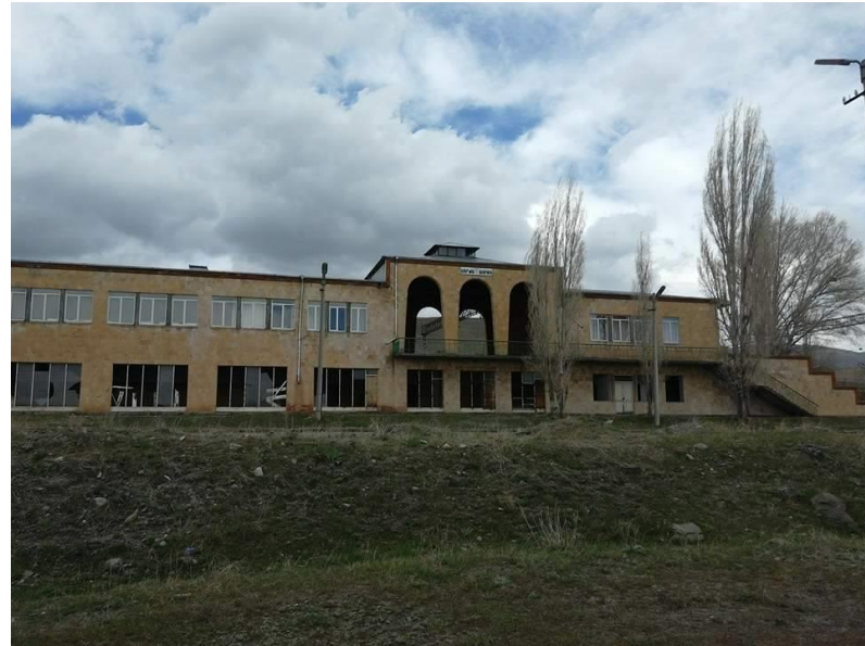
Նկար 3. Շորժայի կայարանի լքված շենքը

լճի ափին զբոսաշրջային ենթակառուցվածքների զարգացման հետ համատեղ, հնարավորություն կտա մեծացնել զբոսաշրջիկների հոսքը դեպի Շորժա – Ծափաթաղ – Վարդենիս հատված: Ժամանակակից էլեկտրագնացքը կսպասարկի ոչ միայն զբոսաշրջիկներին այլ տեղի բնակչությանը՝ էապես կրճատելով մինչև Երևան հասանելիության ժամանակնու ծախսերը: