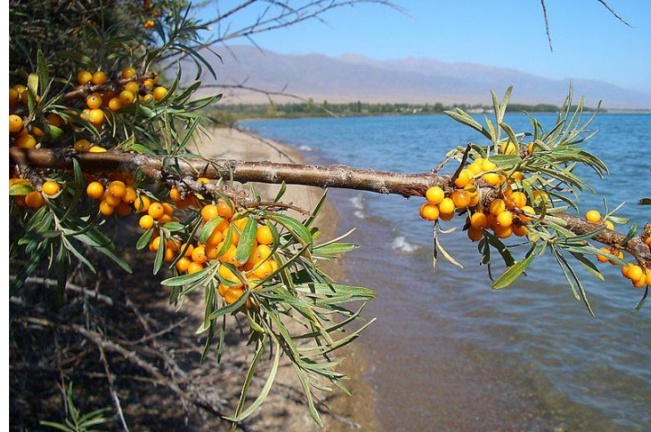
Նկար 8. Չիչխանի թուփը

Անհրաժեշտ է խարխուսել և պետականորեն աջակցել վայրեաճ չիչխանի վերամշակմանը, որպես սպառման թիրախային շուկաներից մեկը դիտարկելով Սևան այցելած զբոսաշրջիկներին: