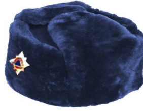
Ձմեռային գլխարկ՝ փրկարարական ծառայության գլխավոր, ավագ, միջին խմբերի պաշտոններ զբաղեցնող ծառայողների համար