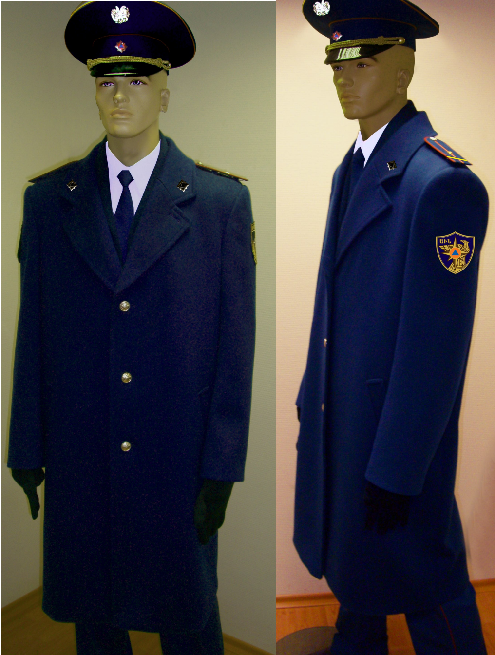
Տոնական համազգեստ՝ փրկարարական ծառայողների համար