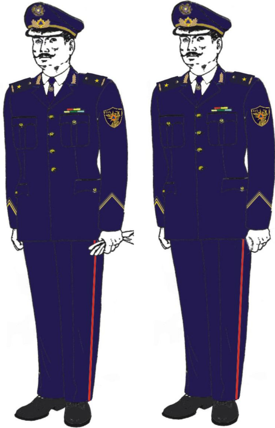
Տոնական համազգեստ՝ գեներալների համար

ե) Փրկարարական ծառայության ծառայողների համազգեստի ձևն է՝