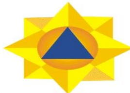
Կոկարդ գլխարկների համար՝ 35 x 35մմ