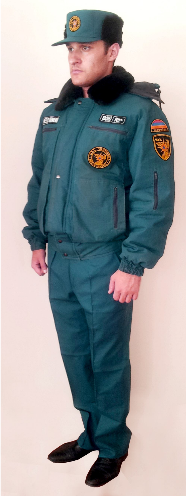
Ամենօրյա ձմեռային համազգեստ՝ փրկարարական ծառայողների համար