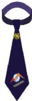
Փողկապ փրկարար ծառայության գեներալների համար