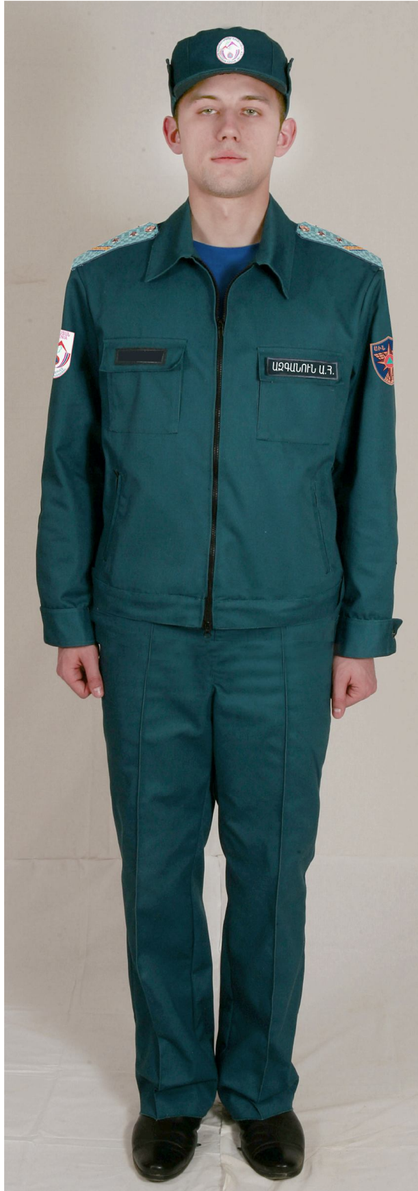
Ամենօրյա համազգեստ՝ փրկարարական ծառայողների համար