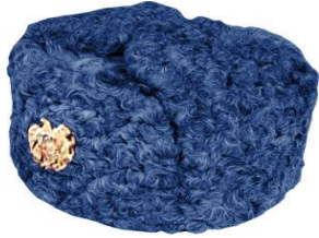
Ձմեռային գլխարկ՝ փրկարարական ծառայության բարձրագույն խմբի պաշտոն զբաղեցնող ծառայողների համար