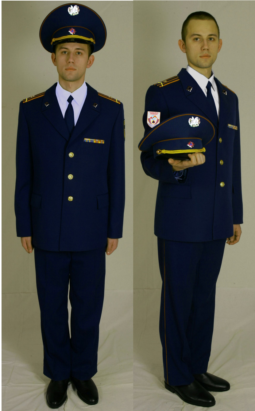
Տոնական համազգեստ՝ փրկարարական ծառայողների համար