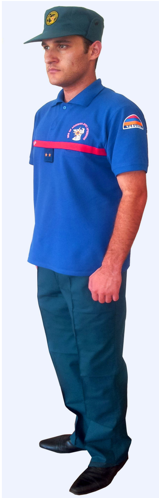
Ամենօրյա ամառային համազգեստ փրկարարական ծառայողների համար