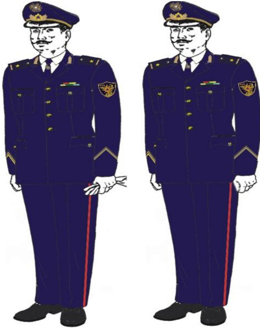
Տոնական համազգեստ՝ գեներալների համար

ե) փրկարարական ծառայության ծառայողների համազգեստի ձևն է՝