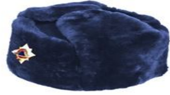
Ձմեռային գլխարկ՝ փրկարարական ծառայության գլխավոր, ավագ, միջին խմբերի պաշտոններ գրադեցնող ծառայողների համար