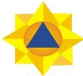
Կոկարդ գլխարկների համար՝ 35 x 35մմ