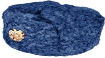
Ձմեռային գլխարկ՝ փրկարարական ծառայության բարձրագույն խմբի պաշտոն գրադեցնող ծառայողների համար