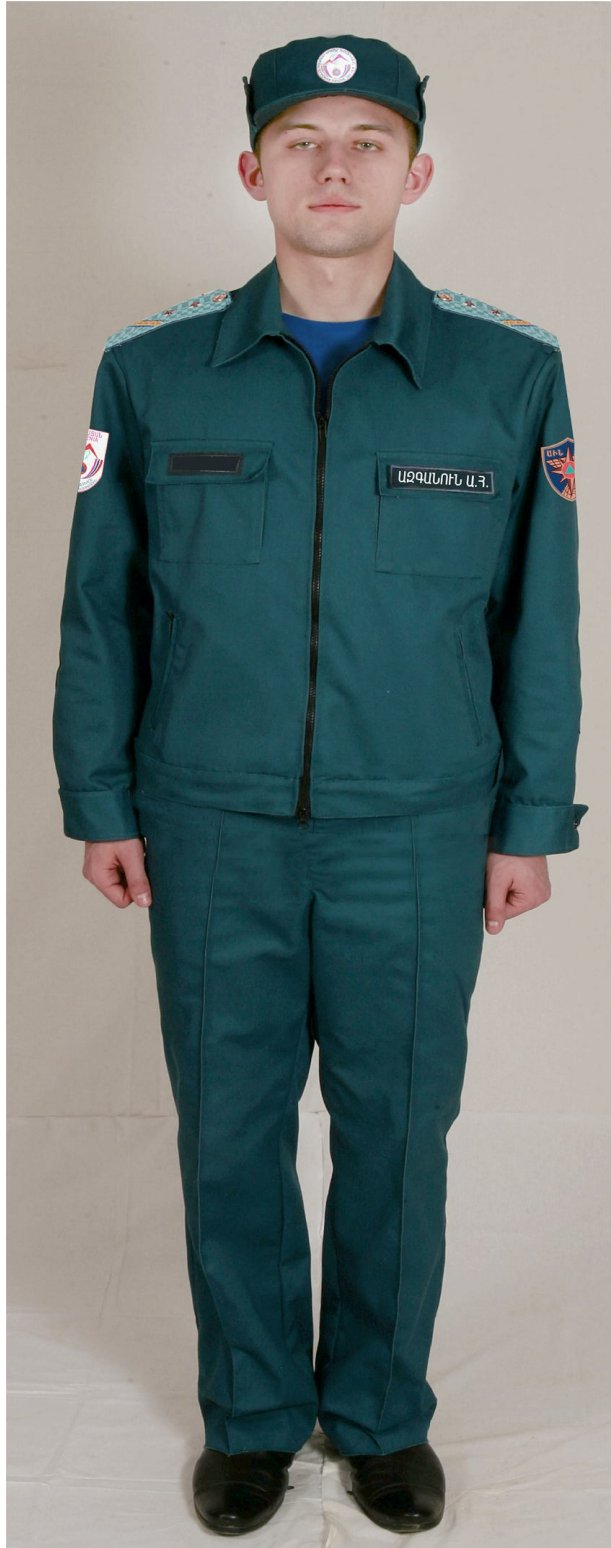
Ամենօրյա համազգեստ փրկարարական ծառայողների համար