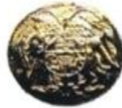
Կոճակներ 22մմ, ոսկեգույն