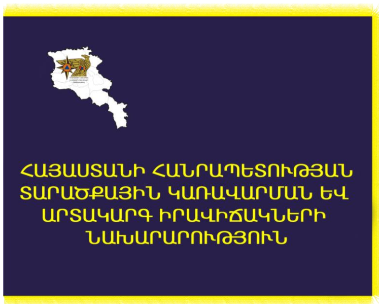
Նկ. 1. Դրոշի երեսի կողմ