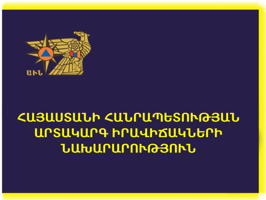
Նկ. 1. Դրոշի երեսի կողմ

ՀԱՅԱՍՏԱՆԻ ՀԱՆՐԱՊԵՏՈՒԹՅԱՆ ԱՐՏԱԿԱՐԳ ԻՐԱՎԻՃԱԿՆԵՐԻ ՆԱԽԱՐԱՐՈՒԹՅԱՆ