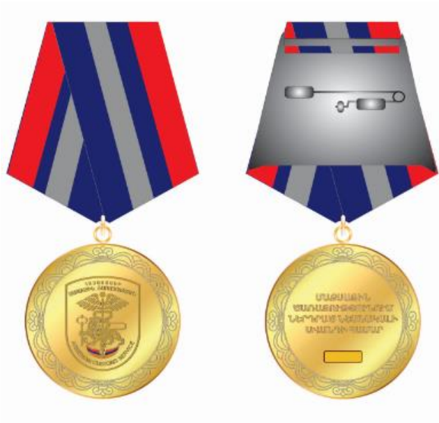
«ՄԱՔՍԱՅԻՆ ՄԱՐՄՆՈՒՄ ԵՐԿԱՐԱՄՅԱ ԾԱՌԱՅՈՒԹՅԱՆ ՀԱՄԱՐ» ՄԵԴԱԼ