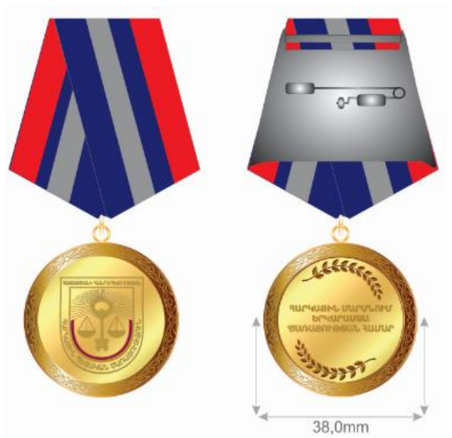
«ՊԱՏՎԱՎՈՐ ՀԱՐԿԱՑԻՆ ԾԱՌԱՅՈՂ» ԿՐԾՔԱՆՇԱՆ