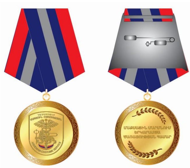
«ՊԱՏՎԱՎՈՐ ՄԱՋԱՍՏԻՆ ԾԱՌԱՅՈՂ» ԿՐԾՔԱՆՇԱՆ